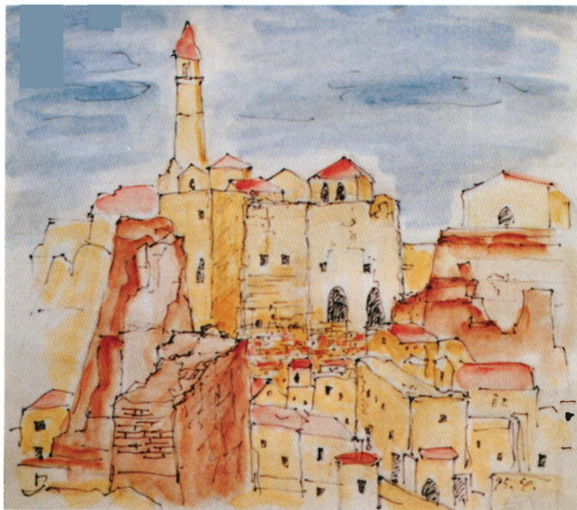
『古城の街』 米山秀雄