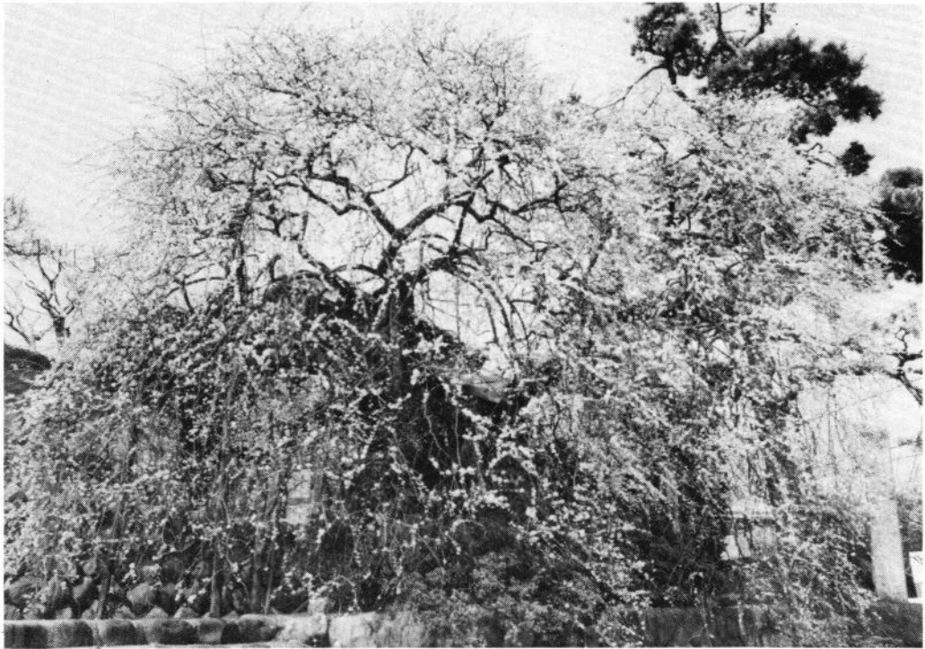
『明白院(青梅市)』 真鍋 勉