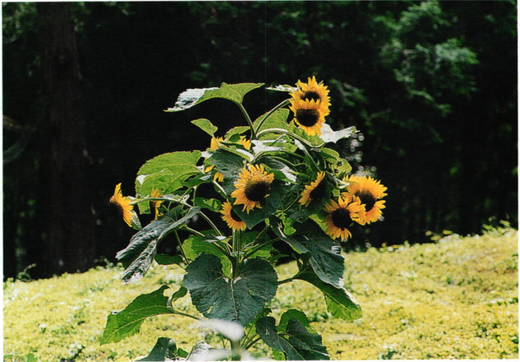
『ひまわり』 真鍋 勉