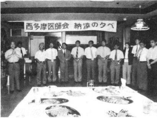
青梅市立総合病院