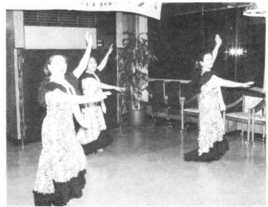
ポリネシア民族舞踊団