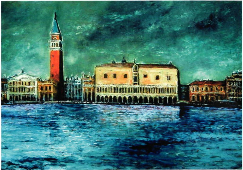
『ヴェネチア』 米山秀雄