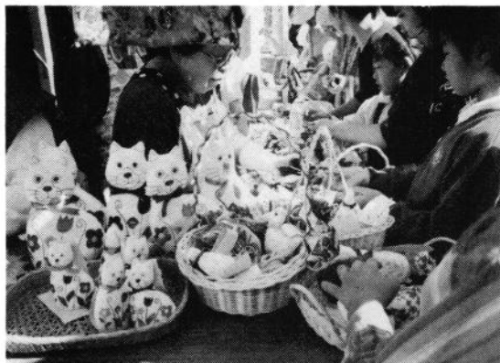
福祉バザーに並んだ小物たち (まだまだたくさんあるヨ)