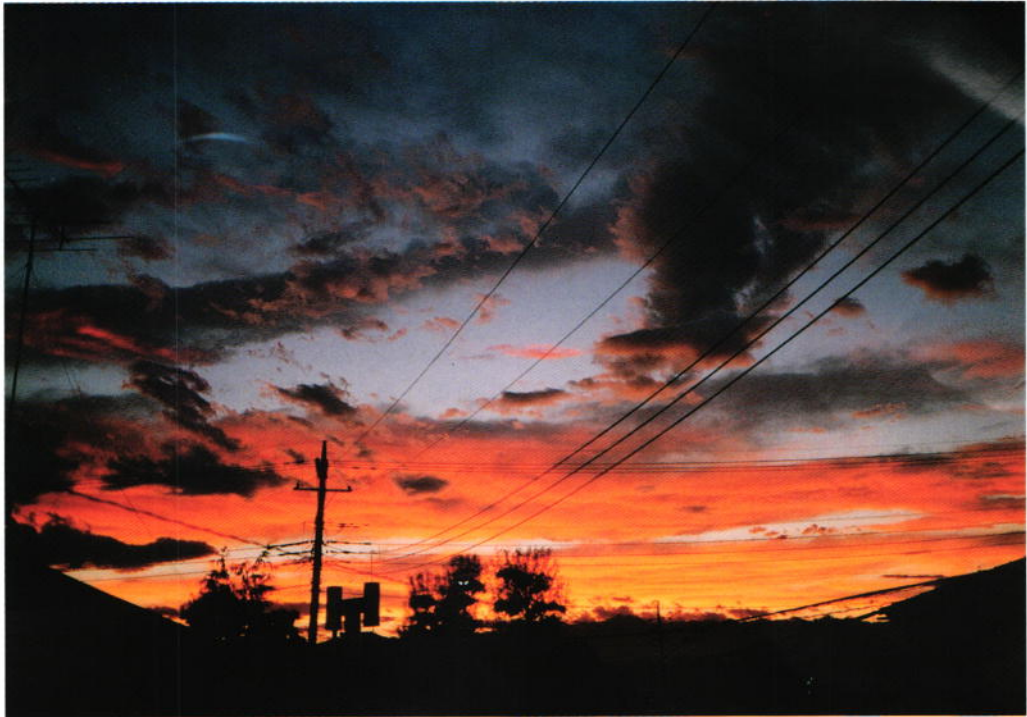
『台風一過』 鹿野純一