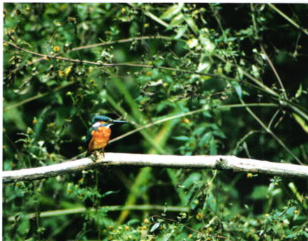
ひとときの安らぎ -カワセミ(♂)- 細谷 純一郎