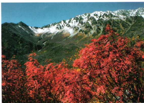
ナナカマドと立山連峰 真鍋 勉