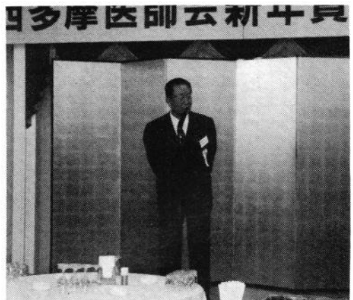
石川衆議院議員 挨拶