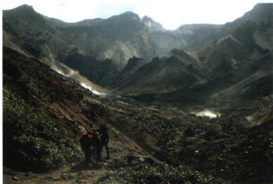
上ホロカメットク山を目指して 石井 好明