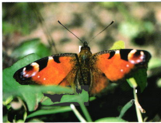
羽休め ークジャクチョウ 坂本 保己