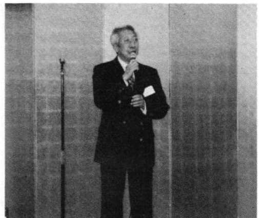
真鍋副会長 閉会挨拶