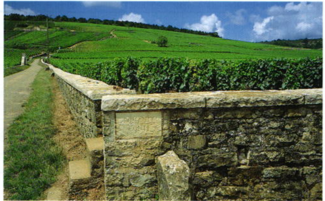
ロマネコンティのぶどう畑 石田 信彦