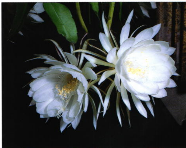
月下美人 稲垣 壮太郎