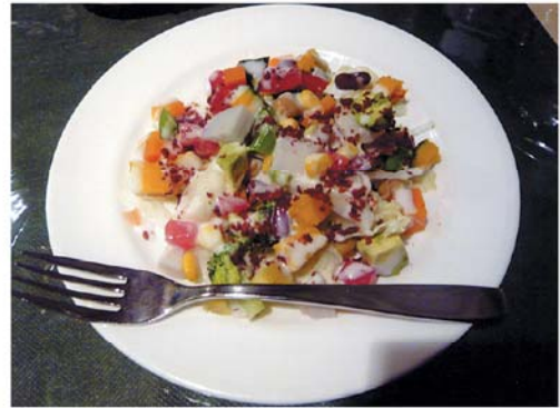
オリジナルサラダ

サラダ、コーヒーつきのコースでも¥1,780と大満足間違いなし。コースを注文する際は、ぜひオリジナルサラダ(単品なら¥370)をチョイスすべし。レタス、お豆、かぼちゃ、ブロッコリー、人参、トマト、おくら、ゆり