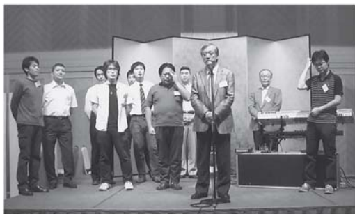
公立福生病院の先生方