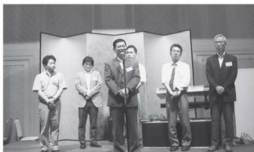
青梅市立総合病院の先生方