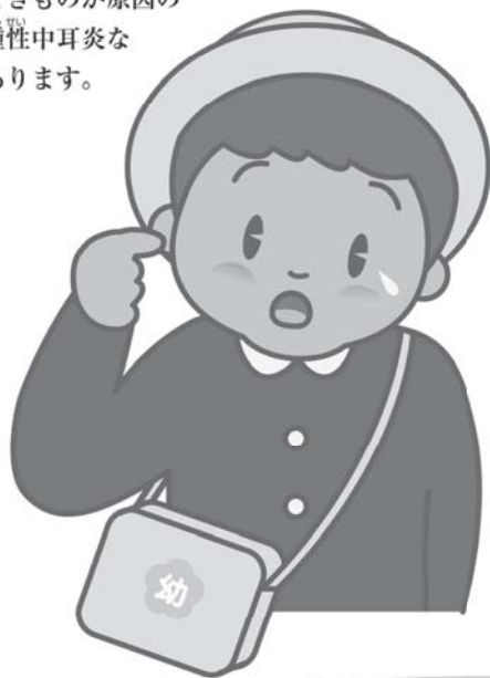
表 主な子どもの中耳炎

そのほかに鼓膜に穴が開いてふさがらない慢性中耳炎、耳の奥のできものが原因の真珠腫性中耳炎などがあります。