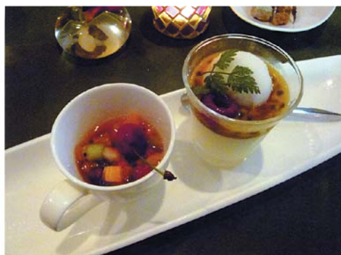
ドルチェ（デザート）

の肉または魚料理は月替わりのメニューのため何度行っても飽きが来ない。またデザート（ドルチェ）は、彩り鮮やかでとってもフルーティー。しかも何種類かの中からお好みをチョイスできる。また、ランチタイムメニュー（パスタランチ¥1,200〜）やディナーコースとしてルチエンティ（シェフお任せコース、¥5,250）などもあり。ちょっとした家族の記念日や少人数のパーティーなどにぜひお勧めの店である。