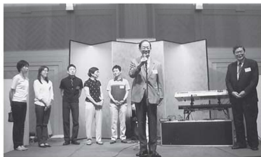
公立阿伎留医療センターの先生方