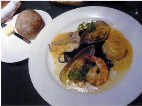
ピストロむく 魚介とイカスミスパグッティーの海老ソース