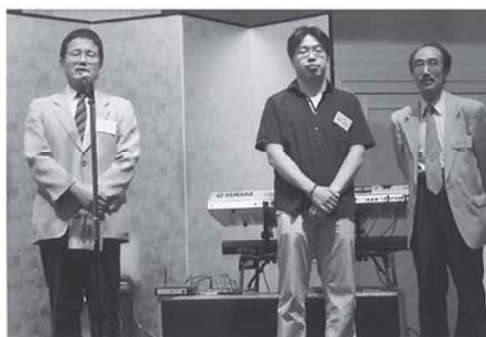
目白第二病院の先生方