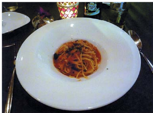
ガレリア・ルチエンティ タコのトマトソース・パスタ

まず1つめは八高線の東福生駅から徒歩2分、武蔵野台にあるイタリアンレストラン「ガレリアルチエンティ」。この店は、ある一流レストランのシェフだったオーナーが、独立して3年ほど前に開店した店である。ディナーコースのうち特に我が家のおすすめは、メルカート（前菜盛り合わせ、パスタ料理、魚または肉料理、デザート、自家製パン、コーヒー）。お値段も何とリーズナブルな¥3,500（六本木、青山あたりなら多分1万円くらいしそう）。しかも一つ一つの料理の盛り付けがおしゃれで味も文句なし。特にイタ飯屋の生命線ともいえるパスタは、絶妙の程よい硬さにゆでられていて、もちろん単品でオーダーしても十分満足できる。メイン